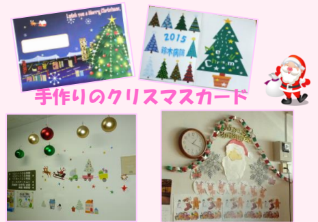
手作りのクリスマスカード