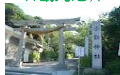
小動神社・小動岬