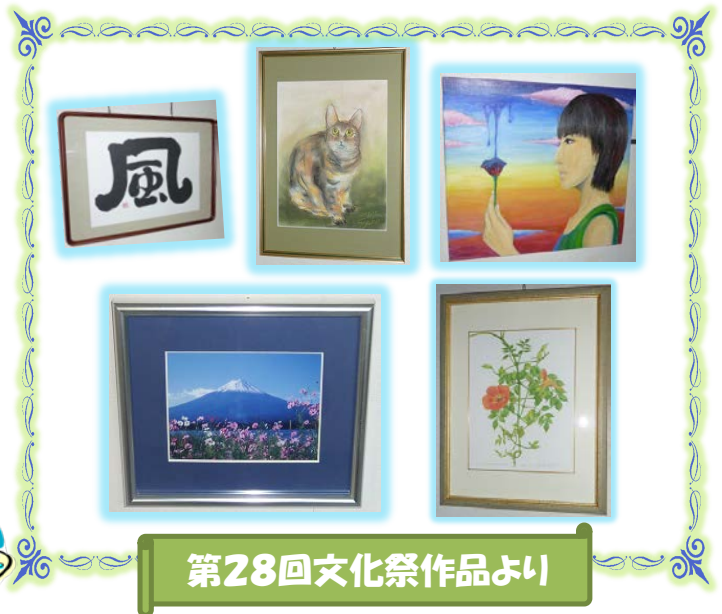
第28回文化祭作品より