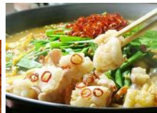
とんこつラーメン