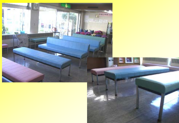
高さの違う外来待合所のイス

鈴木病院の外来待合所のイスが新しく変わりました。これから診察を受ける患者さんの不安な心を少しでも和らげ、明るい雰囲気の中でお待ちいただけるように、ピンク・青・緑の明るくて、かわいいパステルカラーを取り入れました。座る方のニーズに合わせてイスの高さが3タイプあり、ピンク・青・緑の順に少しずつ高くなっています。皆さんからも病院の中が明るくなって、イスの座り心地もいいとの事です。皆さんも来院された際には、新しく変わったイスの座り心地を体験してみてくださいね！！